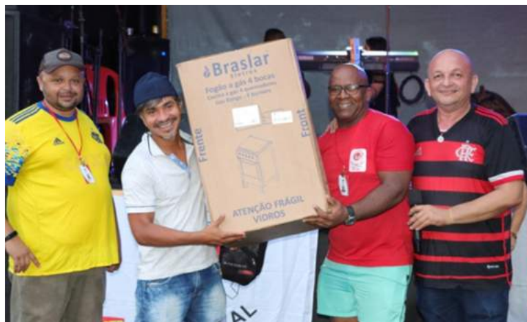
Durante a festa foram sorteados diversos prêmios para os trabalhadores. Os sindicalizados ganharam fogão, TV's LED, eletroportáteis, e quatro poupanças de R$ 500,00.

Foram parceiros da festa, a empresa Só Saúde, que doou uma ambulância para atendimento de emergência durante a festa; a Rádio Alô FM, CTB, Sindehotéis, Sindpanip, Sindvigma, além dos grupos musicais e cantores que se apresentaram ao longo da festa.