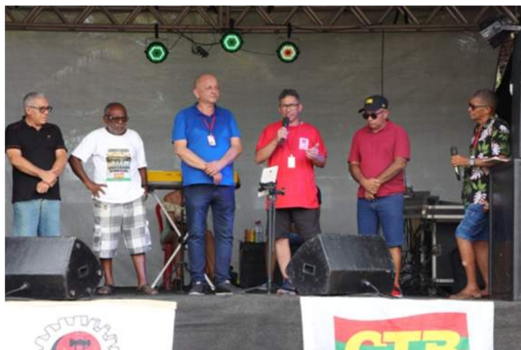
Abaixo, lideranças sindicais fazem Ato Político para reflexão dos trabalhadores em relação ao 1º de Maio - Dia do Trabalhador, e não Dia do Trabalho.